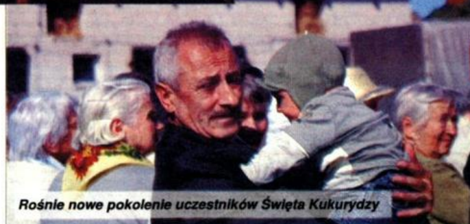
Rośnie nowe pokolenie uczestników Święta Kukurydzy

– Życzę wam tego, żeby ceny skupu mleka wróciły do poziomu sprzed kilkun-