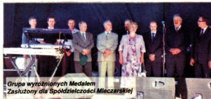
Grupa wyróżnionych Medalem Zasłużony dla Spółdzielczości Mleczarskiej